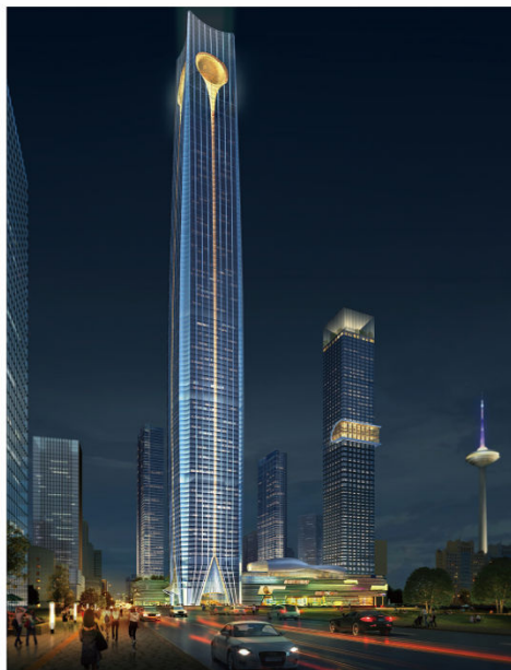
沈阳宝能环球金融中心